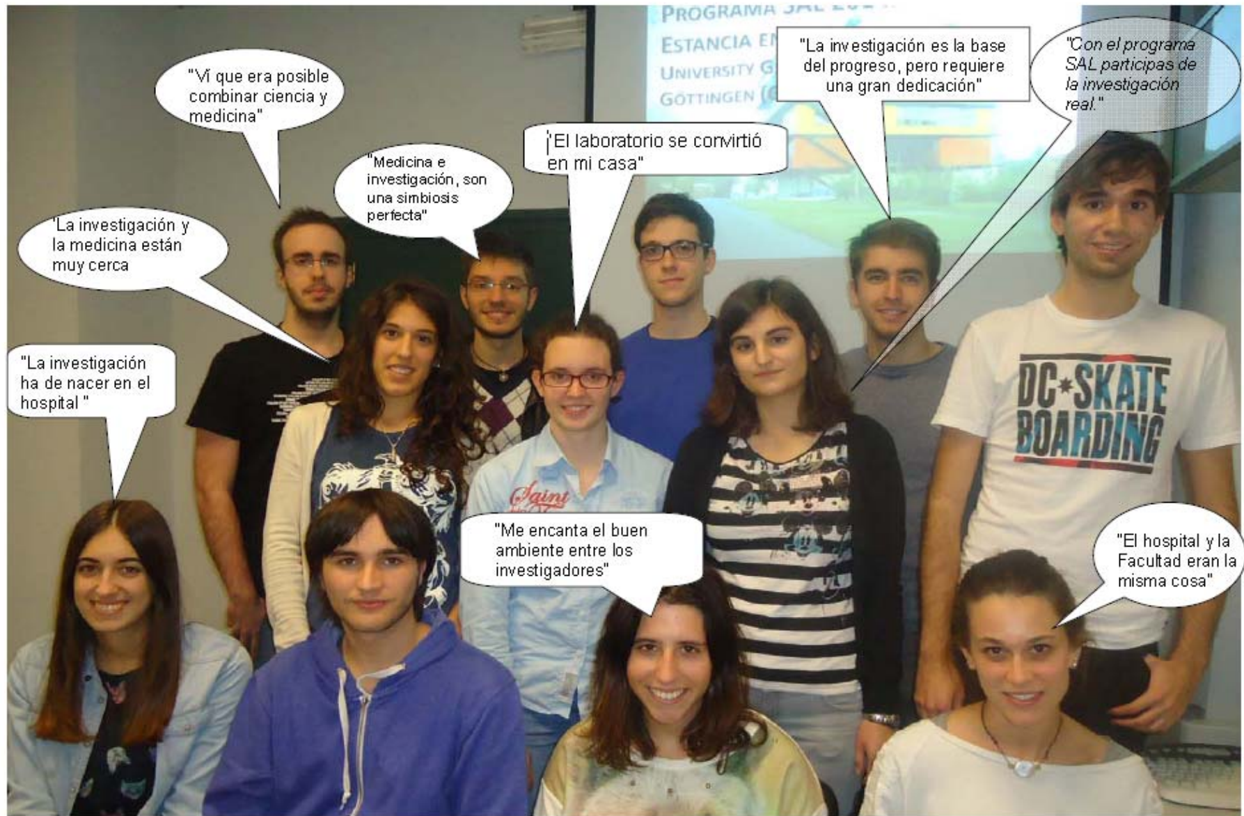
Foto de grupo con impresiones de su experiencia